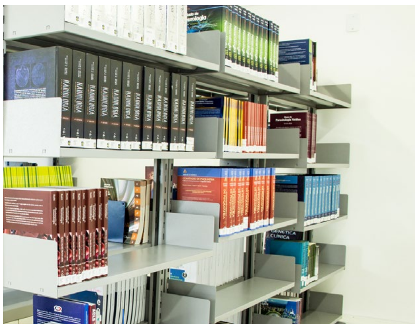
Biblioteca - São Leopoldo Mandic de Araras/SP

Diante desse acervo, os alunos da Faculdade São Leopoldo Mandic Araras podem utilizar esses livros, não sendo necessário comprá-los. O acervo disponibilizado permite condições excelentes de estudo e atualização.